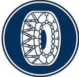
「タイヤチェーンを 取り付けていない車両通行止め」 の規制標識